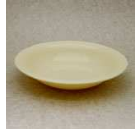
プレート皿 直径 19cm