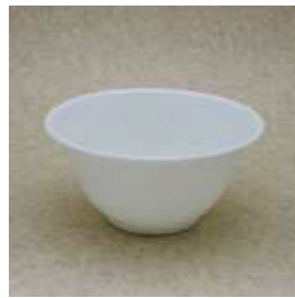
深皿 直径 14cm 深さ 7cm 550ml