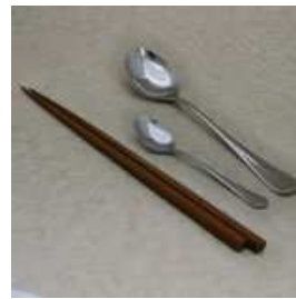
箸（木製 or プラスチック製） スプーン（ステンレス製）大のみ