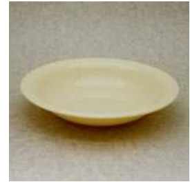
プレート皿 直径 19cm