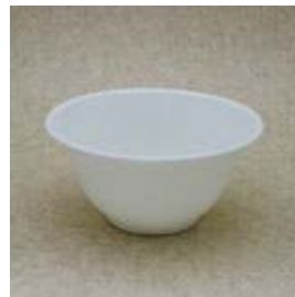
深皿 直径 14cm 深さ 7cm 550ml